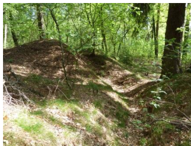
2. Altbergbau